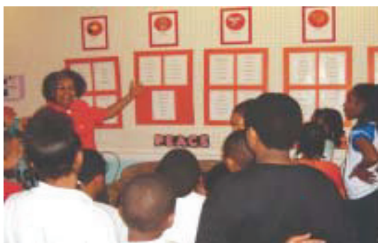
Stati Uniti d'America